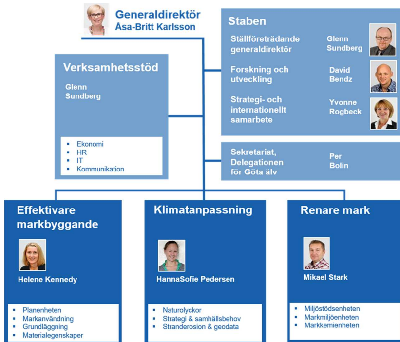
Figur 1. Organisationsschema SGI.