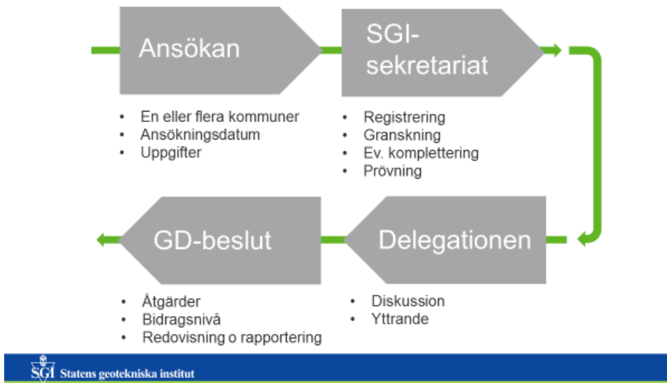
Figur 3. Förslag till ansökningsprocess.